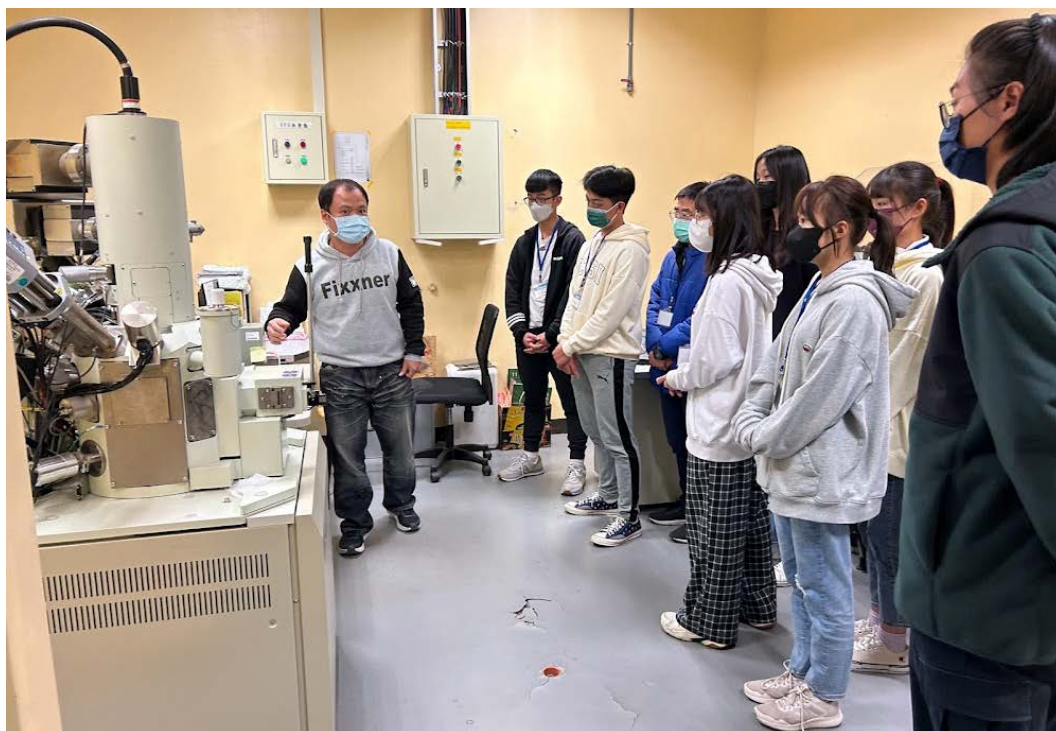
貴儀中心高鈺程博士詳細解說高端儀器