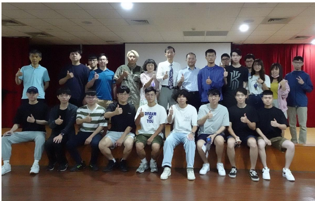
美國新墨西哥大學雙聯學位演講大合照